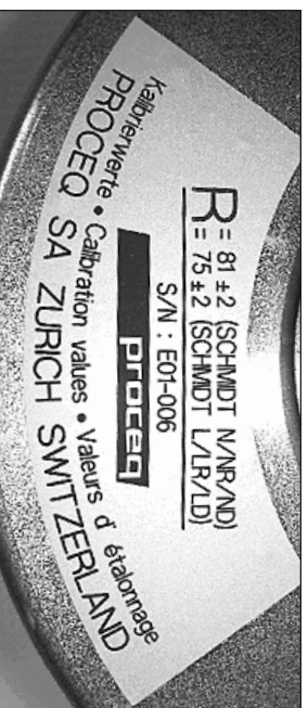
Fig. 4 Schild mit Angabe der Kalibrierwerte Sticker displaying calibration values