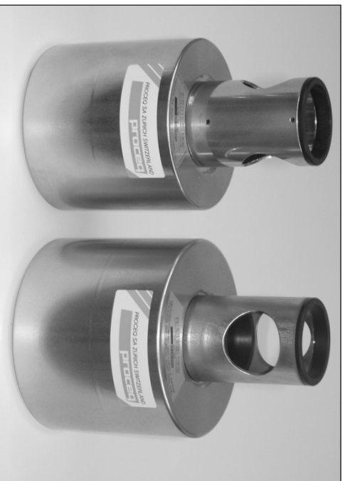
Fig. 1 Links: alter Kundenamboss Rechts: neuer EURO-Amboss

PROCEQ SA war deshalb gezwungen, neue Kundenambosse für Europa und den Ländern, wo die europäischen Normen zur Anwendung kommen, zu produzieren. Die Unterschiede zwischen dem neuen und alten Kundenamboss sind offensichtlich (Fig. 1).