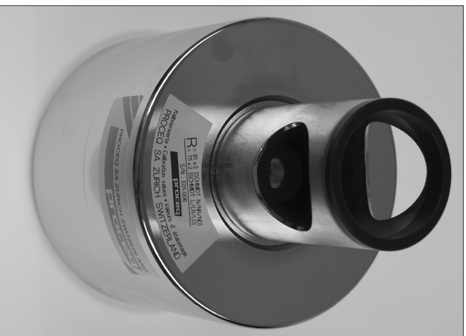
Fig. 2 EURO-Amboss / EURO-Anvil

Durch die Erhöhung der Härte von HRC 28 auf HRC 52 werden die Messwerte auf die Dauer stabiler. Der Rückprallwert steigt jedoch nur um ca. ein R (von 80 auf 81 für N-Hammer, von 74 auf 75 für L-Hammer). Das war auf Grund der Rückprallwerte, welche auf dem Basisamboss mit ähnlicher Härte wie der EURO-Amboss erzielt werden, zu erwarten. Ein anderes wichtiges Kriterium um stabile Werte innerhalb der erwarteten Toleranzen auf dem Amboss zu garantieren ist die Form der Schlagfläche. Wie bekannt, haben unsere Ambosse die spezielle sphärische Form, angepasst an der Form der Schlagfläche des Schlagbolzens des ORIGINAL-SCHMIDT Hammers. Der neue EURO-Amboss hat die gleiche sphärisch geformte Schlagfläche, obwohl dieses Kriterium in der EN 12504-2:2001 nicht erwähnt ist. In den folgenden Bildern ist die sphärische geformte Schlagfläche und der neue Bereich der Kalibrierwerte angegeben.